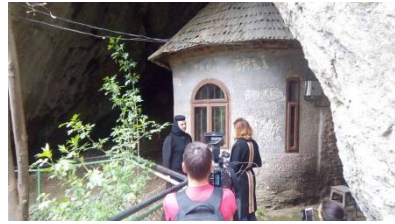
Foto – Caravana TvR 3

a Proiectului "Costești, sat cultural 2016" în cadrul căruia am obținut un titlu care ne onorează dar ne și obligă în aceeași măsură.